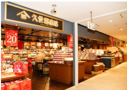
弊社運営「サンクゼール・久世福商店 心斎橋オーパ店」