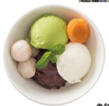
老舗あんこやのあんみつ