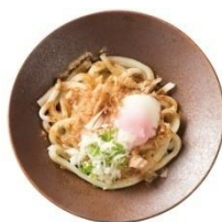
万能だしのだし玉うどん